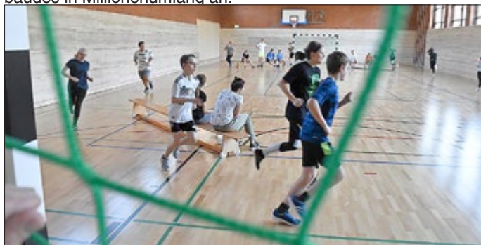
So wie die 7. Klasse freuen sich alle Schüler über die nagelneue Sporthalle.