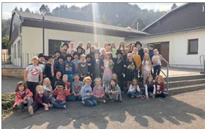
Die Kirmesburschen luden uns in den Hafen ein und wir konnten mit ihnen feiern.