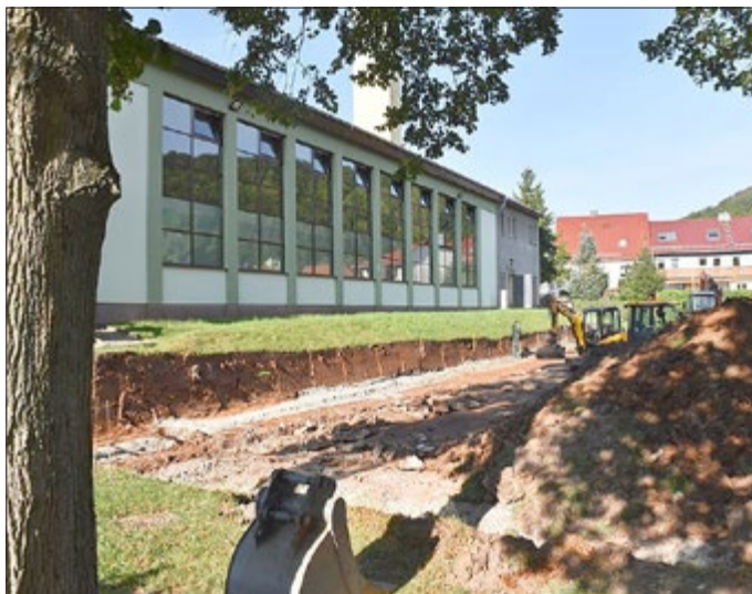
Die Bauarbeiten am neuen Bolzplatz sind inzwischen weit fortgeschritten.